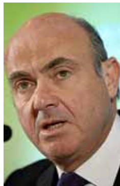
Luis de Guindos.