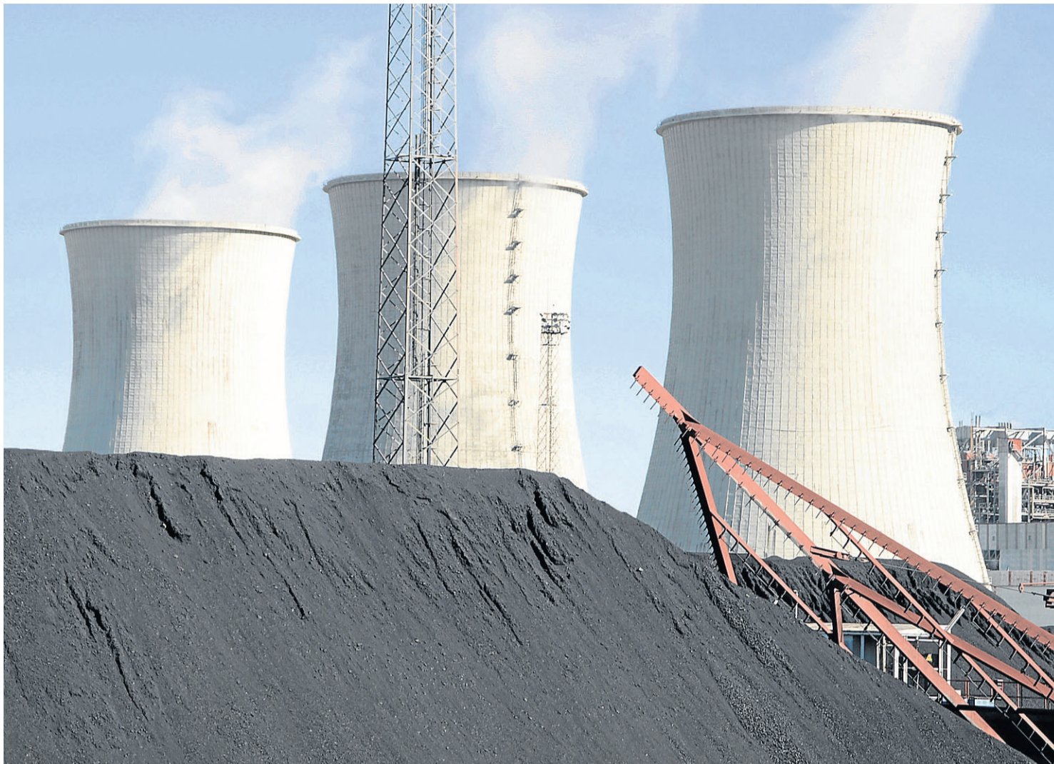
Instalaciones de la central térmica de Andorra en Teruel.

El principal coste de la factura es la parte fija, que incluye la potencia contratada, a veces más cara que el consumo, y los impuestos