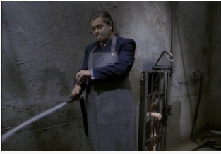
El interrogatorio (Przesluchanie)