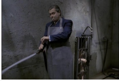
El interrogatorio (Przesluchanie)