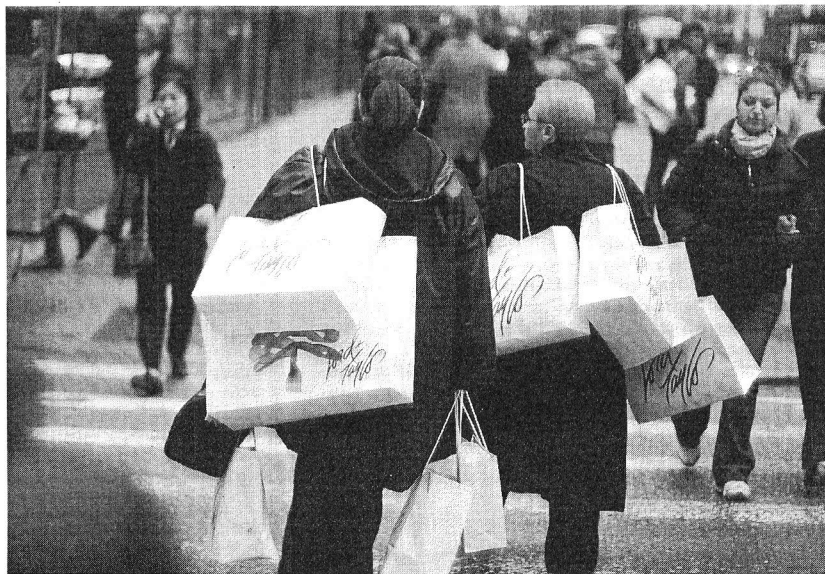
» Compradoras el viernes pasado en la Quinta avenida de Nueva York.

Esos 195 millones de compradores, no obstante, se han dejado de media un 8% menos en las cajas registradoras que hace 12 meses. La media de gasto, que el año pasado rondaba los 250 euros, ha bajado en el 2009 a menos de 230 euros por persona. Y pese al incremento en el número de compradores la cifra de gasto total es prácticamente igual a la del año pasado, rondando los 27.500 millones de euros. Ningún minorista se llama a engaño: son los profundísimos descuentos y los ofertones los que indudable-